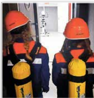
Besuch der Atemschutzübungsstrecke im Feuerwehertechnischen Zentrum Prenzlau als Praxis-Übung.

die Ausbildung zum Erwerb der Juleica (JugendleiterCard) absolviert.