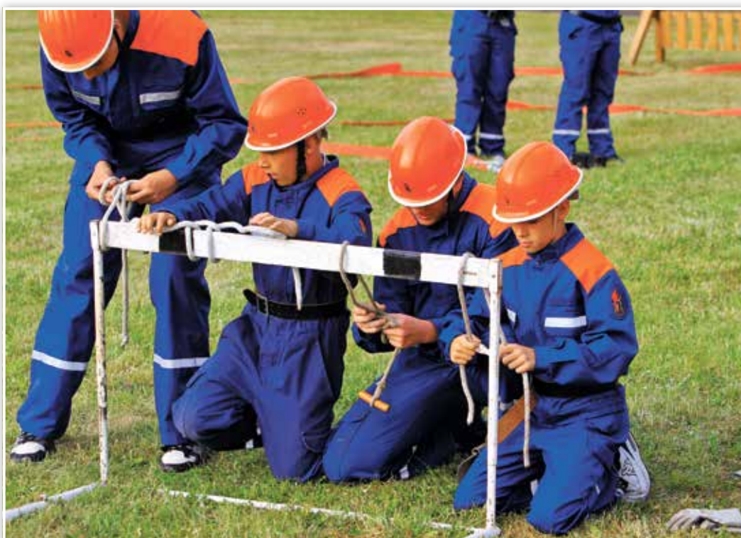
Das Amt Oder-Welse als Träger des Brandschutzes stattet die Kinder und Jugendlichen mit einer altersgerechten Einsatzkleidung aus. Dazu gehören Einsatzjacke und -hose, Helm, Schuhe, Handschuhe und Gurt.

Die Jugendfeuerwehr soll die Kinder und Jugendlichen ihrem Alter entsprechend mit Spaß und Spiel auf den aktiven Dienst in der Feuerwehr vorbereiten. Dafür werden in den Jugendgruppen Dienstpläne für die Kinder erstellt, die beispielsweise Strukturen innerhalb der Feuerwehr und bei der Abarbeitung der Lösch-einsätze, den Umgang mit der Einsatztechnik und Regelungen zur Unfallverhütung theoretisch und praktisch abdecken. In jedem Jahr gibt es zahlreiche Möglichkeiten für die Kinder, ihre Gemeinschaft zu stärken, die Fähigkeiten und Fertigkeiten auszubauen, ihr Können unter Beweis zu stellen und sich in Wettkämpfen zu messen. Betreut werden die Kinder von erfahrenen Kameradinnen und Kameraden der Freiwilligen Feuerwehren, die in ihrem Berufsleben beispielsweise als Pädagogen, Erzieher oder Krankenschwestern unterwegs sind. Für die Arbeit mit den Kindern und Jugendlichen in der Jugendfeuerwehr haben Sie