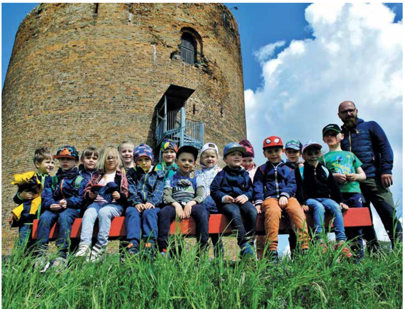
Die Biber-Gruppe aus der Kita Pinnow auf der Bildungsfahrt ins Untere Odertal

Herausgeber: Amt Oder-Welse – Der Amtsdirektor | Gutshof 1, 16278 Pinnow | Telefon: (03 33 35) 7 19-0 | Fax: (03 33 35) 7 19 40